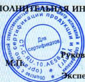
Схема сертификации: 3с.